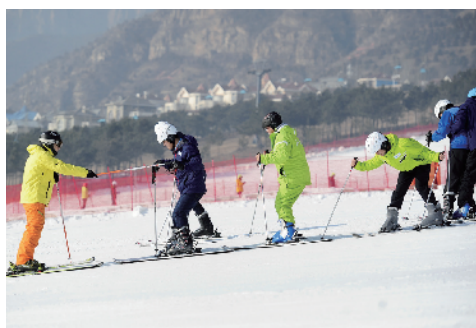
一群新手从初级道开始练习