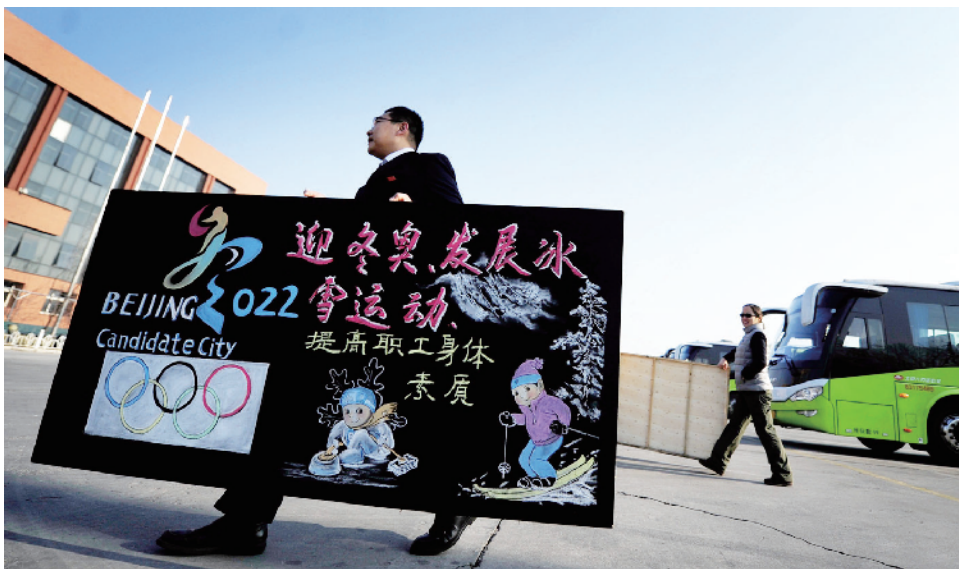
制作黑板报向职工普及冰雪运动知识

“其实滑雪跟开车一样，是熟练工种，只要保持高度的安全意识，摔倒的几率是很低的。”汪博说。