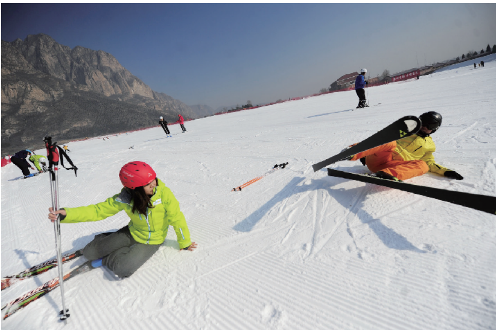
摔倒后要如何站起来