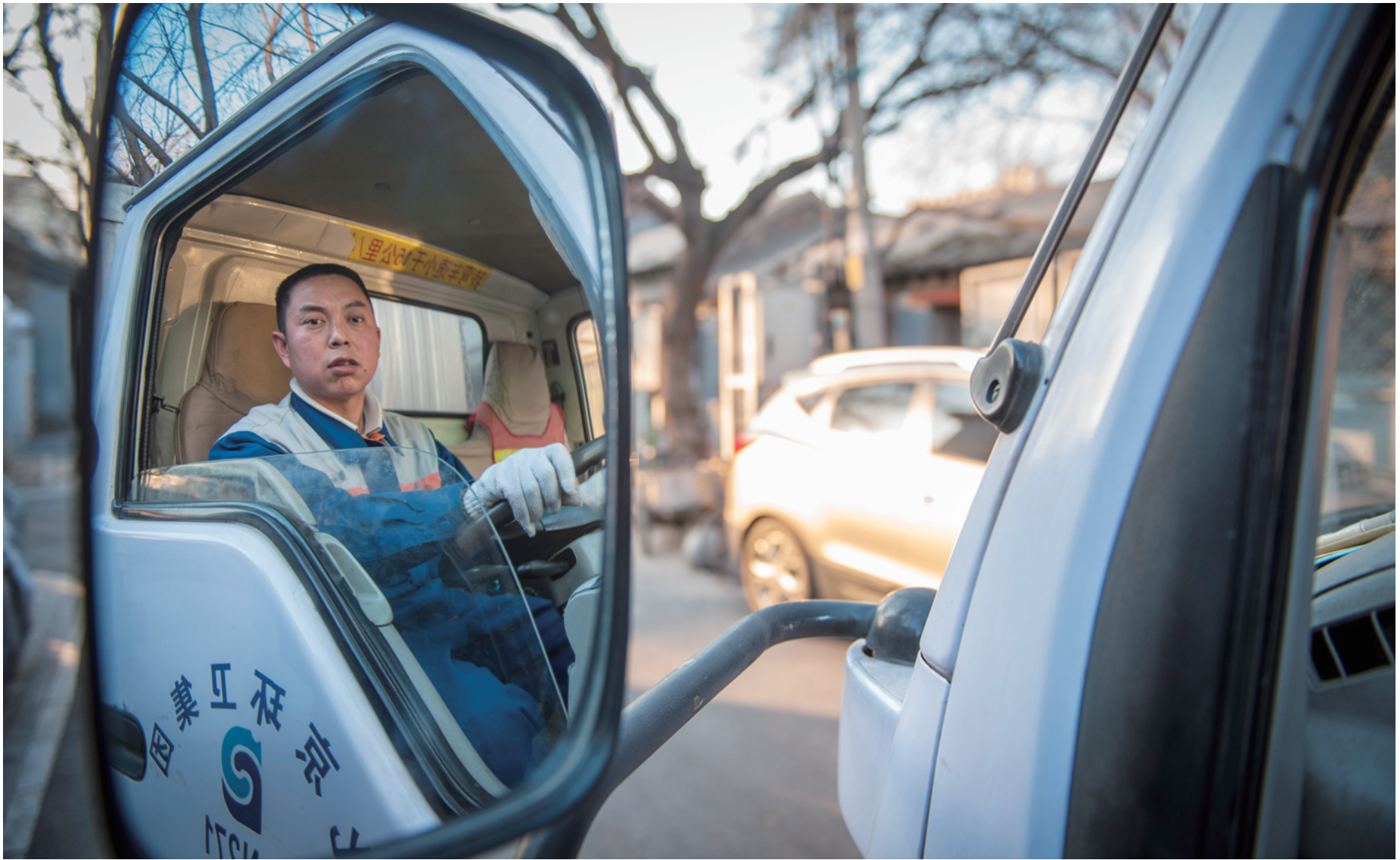
有些垃圾站设在胡同内，清运车体积大，对司机的驾驶技术也是考验。