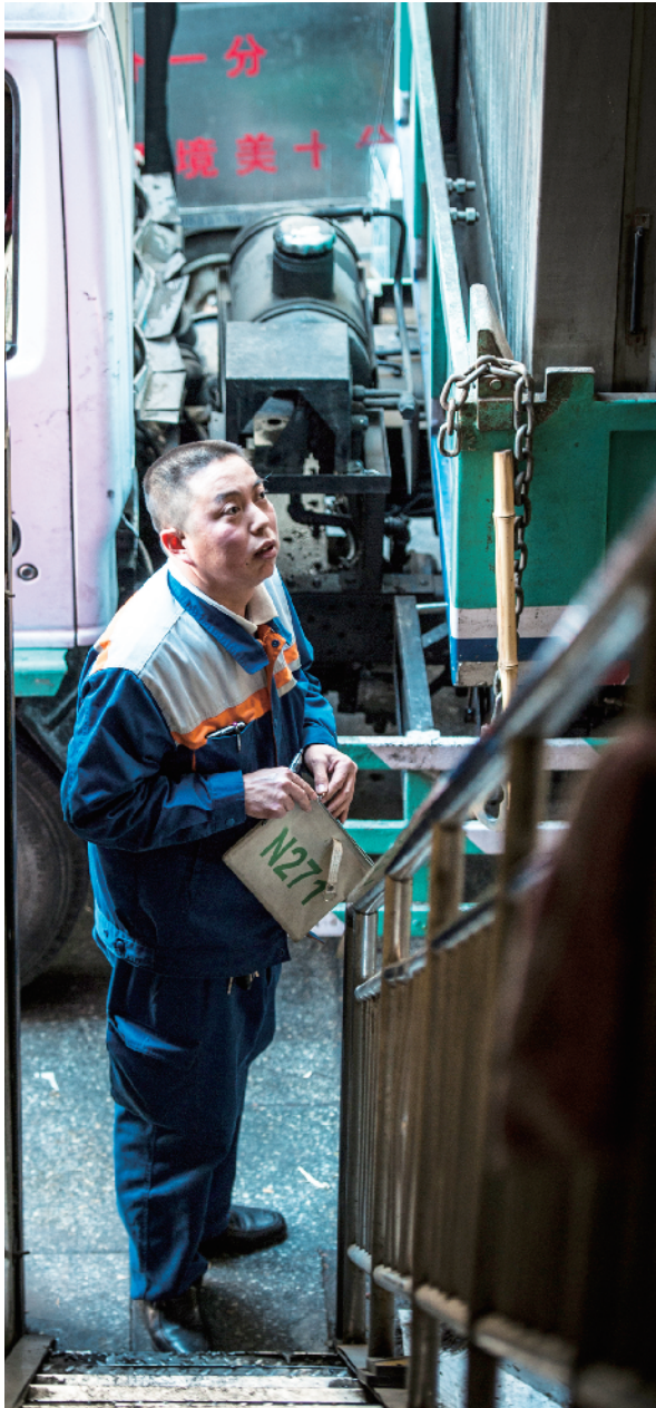
每到一个清理站，都要做好记录。

职工故事 行进京华大地 讲述精彩故事 线索征集邮箱: ldwbtyw@126.com