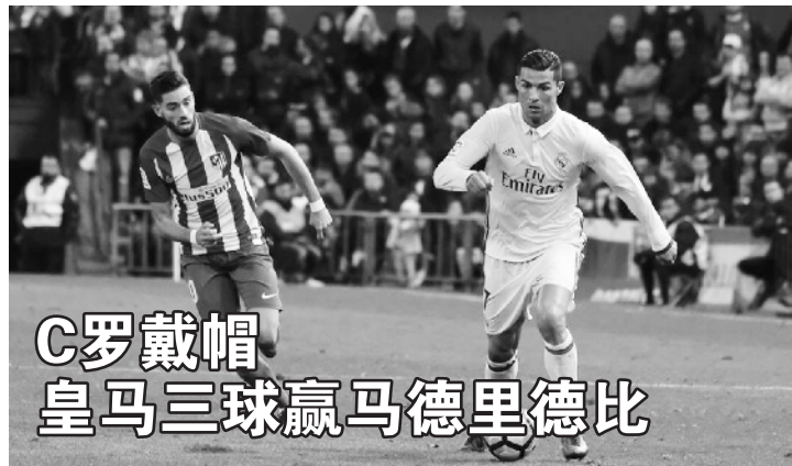
C罗戴帽 皇马三球赢马德里德比

上轮围甲中信北京惨遭重庆零封,华泰证券江苏队也1比3不敌杭州,两队均曾取得过3连胜,目前各积29/27分列积分榜第7/8位,身居中游急需佳绩确保好名次。在联赛还剩3轮的情况下,杭州队37分领跑,云南队36分紧随其后,重庆队位居第三。