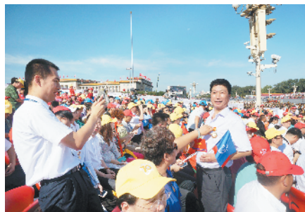
劳模代表观礼“九三”阅兵

要以职工需求为导向，通过帮助职工提升应对就业市场竞争的能力、减轻工作压力，在服务职工上有新拓展；要加大力量宣传职工职业技能提升活动，让更多的职工加入进来，提升自身素质，在全区营造劳动创造幸福的新理念。”