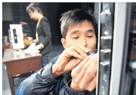
岗位练兵——锁具维修