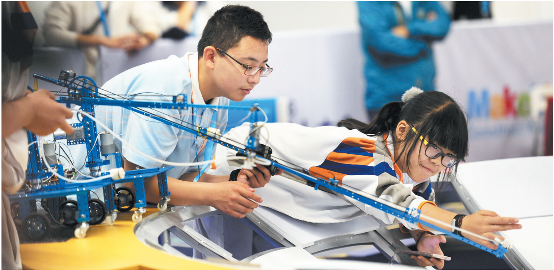
参赛的中学生排除故障。