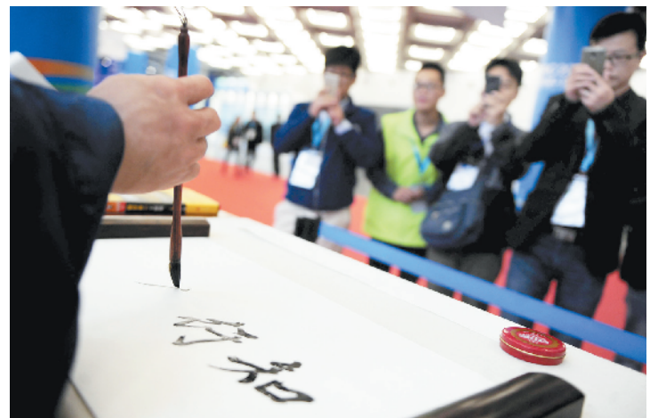
会书法的机器人当场挥毫。