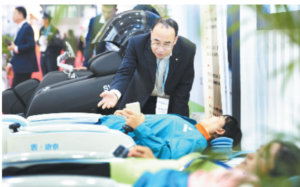
参展商请市民体验医疗诊断与健康管理平台，放松身体。