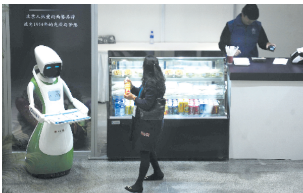
服务型机器人为餐厅“站台”。