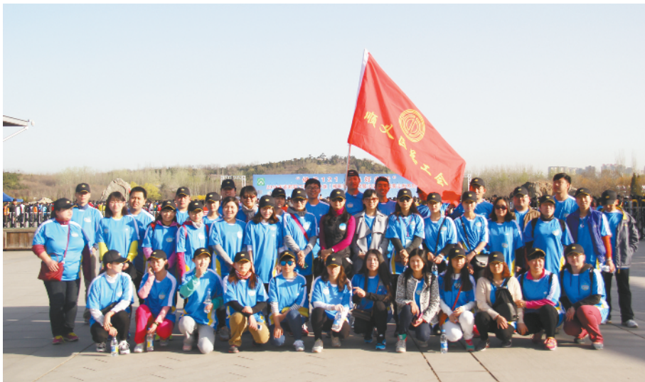
▲参加2016年首都职工健步走活动

2015年,“面对面、心贴心、实打实服务职工在基层”活动中取得经验的基础上。今年,文化宫开展了一系列特色鲜明,丰富多彩的文娱活动。举办了顺义区第二届“最美劳动者”职工文化艺术节,从生活美、发现美、健康美、凝聚美四个板块逐步进行。“生活美”群众文化板块包括职工歌手大赛、职工舞蹈大赛两项活动,以歌唱、舞蹈的形式,赞美生活、赞美家乡,歌颂劳动精神,展示广大职工积极向上的精神风貌。“发现美”职工原创作品展示板块包括职工书法比赛、职工美术作品比赛、职工手机随手拍比赛三项活动,立足于为引导更多职工发现美、捕捉美、记录美,多角度地反映职工工作、生活、宜居环境,以职工的视角,通过书法、绘画、摄影等形式以小见大地折射出职工对祖国、对劳动生活的热爱。“健康美”职工健康生活板块主要包括“健康美”职工健身操比赛,通过职工健身操活动的开展,在职工中掀起健身的热