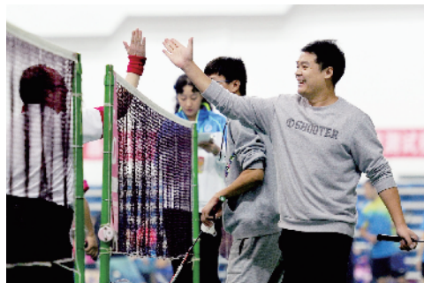
友谊第一，比赛第二