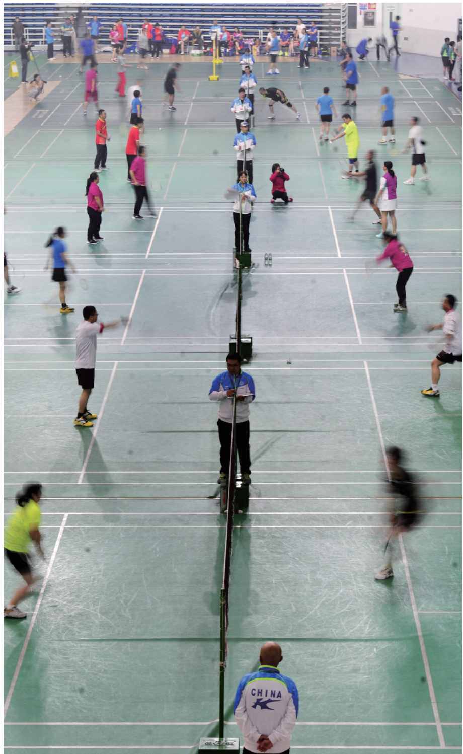
羽毛球赛场争高下

为办好这次职工运动会，园林绿化局工会在活动前经过广泛的调查，选取了职工最为喜爱的几项运动项目，并全面安排好后勤保障工作，让职工在赛场上尽情全面展示自己的风采。