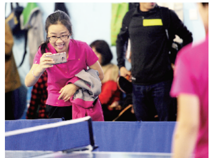
场上运动员场下摄影师