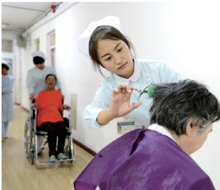
医护人员定期为病人理发、洗澡。