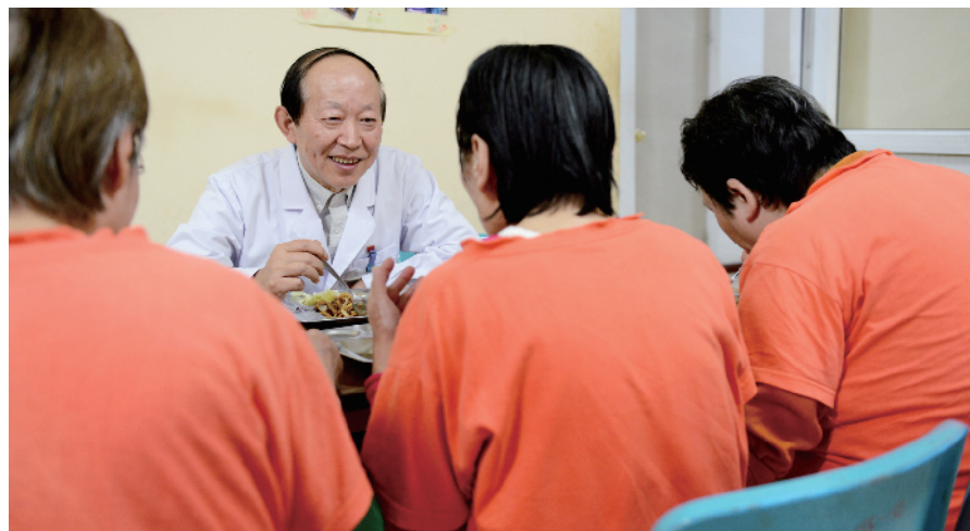
和患者交谈,既能增进医患之间感情,还能随时掌握患者的病情。