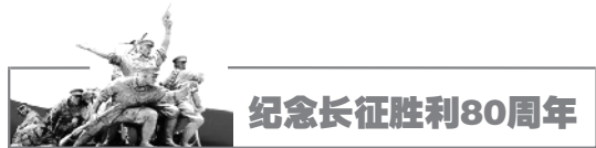
纪念长征胜利80周年

今年上半年,十八届中央第九轮巡视对辽宁、安徽、山东、湖南等4个省首次进行了“回头看”。这是中央巡视第二次开展“回头看”。