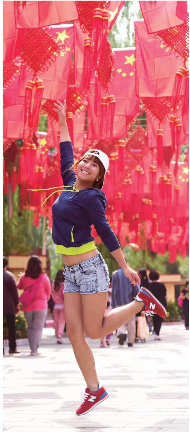
八大处公园成了国旗的海洋，吸引游客驻足拍照留影。