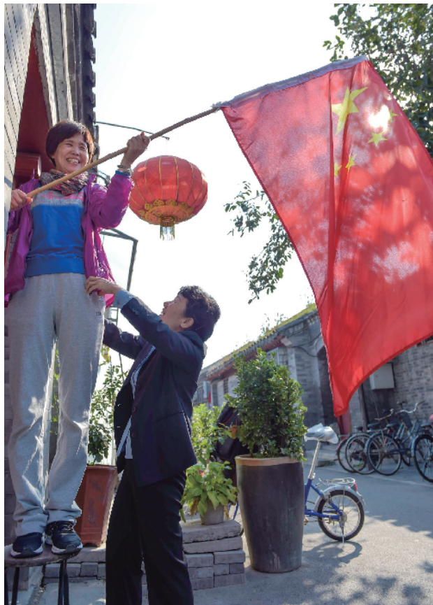
交道口工会服务站的工作人员和胡同居民们一起挂国旗。