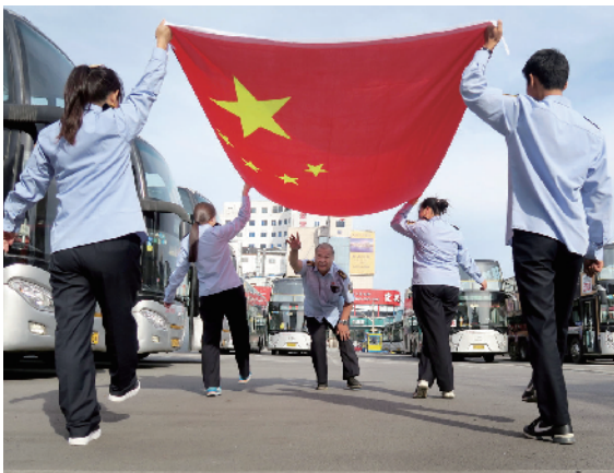
公交特9内环职工来到场站参加升旗仪式。