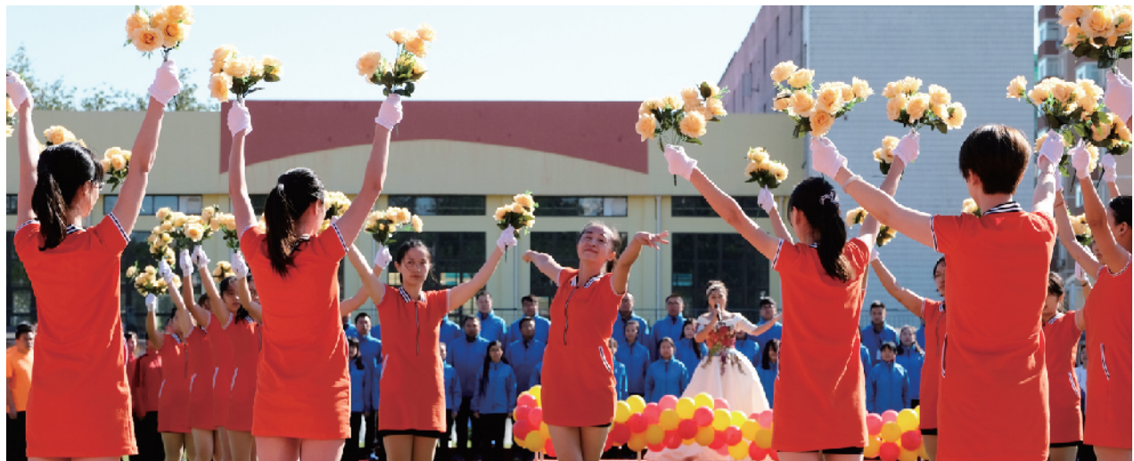
中电建筑集团职工跳起欢快的舞蹈庆祝国庆。