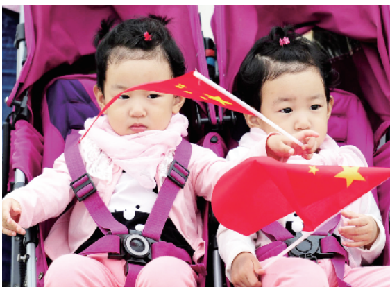
孩子手中的国旗，是来京旅游者的“标志”。