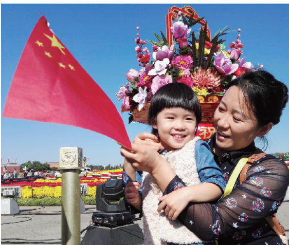
小朋友在妈妈的怀抱中手举国旗笑开怀。