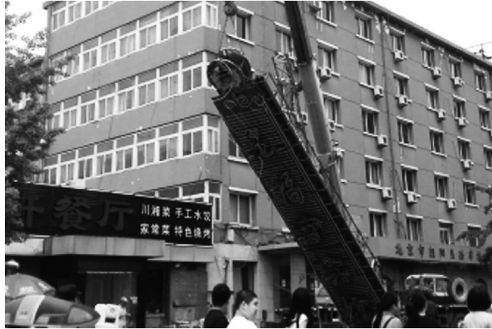
安全性负有检测、监督的义务。为了确保路人的安全，避免广告牌伤人事件发生，应形成一

办法》，凡在户外设置广告，必须经过相关部门审查批准。而有些单位，没有经过批准就擅自设置广告牌。二是广告发布单位没有遵循户外广告设施的安全技术标准、管理标准和规范，甚至是使用了劣质的广告材料，经过风吹雨淋，早已变得摇摇欲坠，一旦遇到刮大风、下大雨，就有可能随时掉下来，砸伤路人。三是有些部门监管不力或睁一只眼闭一只眼。按说这么大的广告牌就矗立在你的管界，有没有合法的审批手续，应该是“门儿清”，可为什么还让广告牌长期存在？而且，作为主管部门，应当对广告牌的