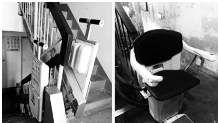
要有一户不同意,加装电梯就没戏。要想排除加装电梯的干扰,首先应研究修改相关规定,出台老楼加装电梯管理办法;其次,应对

为了解决被困老人上下楼的难题,各地也都有不少尝试,但无论是爬楼机还是座椅式升降器都不是太好的解决办法,只有外挂式电梯最可靠。但由于低层住户觉得影响采光,又有噪声,反对加装。而2010年本市多部门下发的《关于北京市既有多层住宅增设电梯的若干指导意见》规定,老楼加装电梯需征得全部业主同意,所以,只