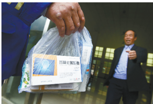
公交892路车组成员为村民捎点儿药品。