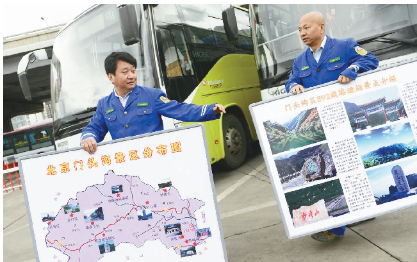
自制旅游信息展板定期更新内容。