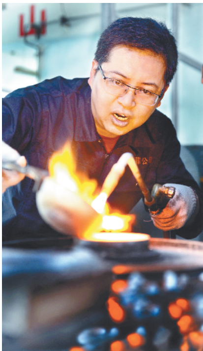
▶温度把控是铸银铸模的关键。