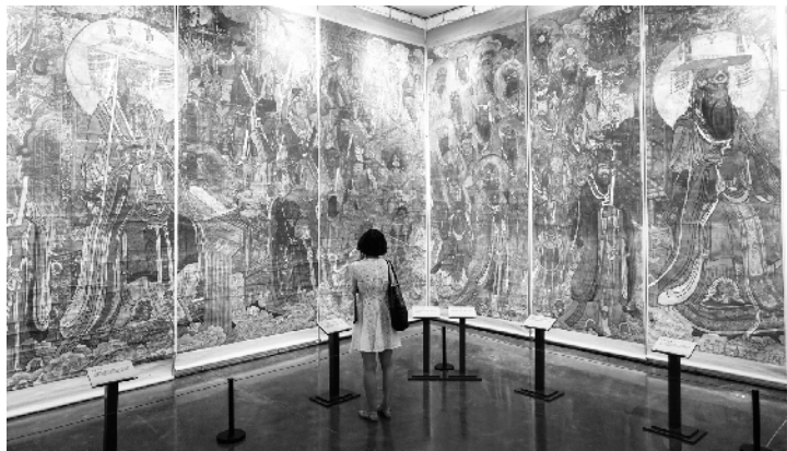
永乐宫元代壁画临摹作品首度亮相

永乐宫，被誉为20世纪最有价值的文化发现，坐落于秦、晋、豫三省交界的山西省芮城县，始建于公元1247年，历经元、明、清三代和民国时期，距今已有近800年历史。是我国现存最早、最大、保存最为完整的园林式道教宫观，是道教三座祖庭之一，以精美绝伦的壁画艺术、富丽堂皇的宫廷建筑、举世瞩目的搬迁工程、博大精深的道教文化誉满天下。永乐宫壁画是除敦煌以外我国另一处举世公认的艺术瑰宝，素有“东方画廊”之美誉。