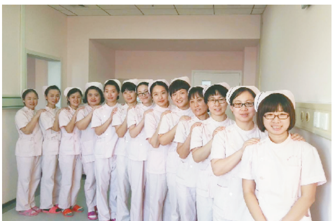
顺义区妇幼保健院 新生儿科护理组

多年来，手术室护理组多次参加了医院的大型抢救工作，如地铁工程塌方、集体车祸等，在抢救中积极配合，加班加点，挽救了无数危重病人的生命，得到了病人家属和广大群众的好评。