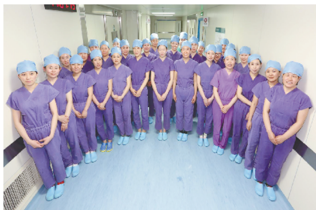
顺义区医院 手术室护理组