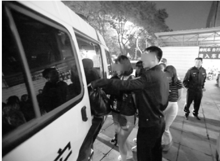
教育与案件查办相结合。网下监管和网上净化相结合。再次，要充分发动群众，形成一张线上线

要想彻底消灭披着各种外衣的卖淫嫖娼隐秘窝点，就必须切断他们之间的黑色利益链条。首先，要开展长期持久的网络“扫黄打非”。对所有相关网站、第三方服务平台进行严格的不间断的检查，实现对隐藏的卖淫嫖娼行为的及时发现和查处。一旦发现有为涉黄窝点提供广告推广、代收服务费的，坚决依法严惩；其次，要坚持“三结合”，即日常监管与专项行动相结合。宣传