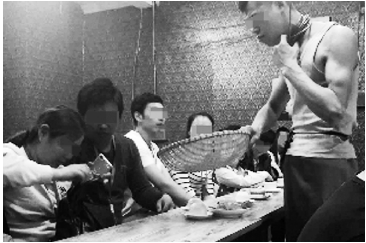
须依法严惩，直至吊销营业资格；再次，要加强对外地游客的宣传

梳理一下“黑一日游”的种种恶劣行径，深深感到治理“黑一日游”是一项难度不小的系统工程。首先，必须采用联合执法的方式。旅游、公安、工商、交通、城管等部门各司其职，互相配合，严防死守，发现一起，顶格处罚一起，绝不手软；其次，要切断黑社、黑导、黑车、黑店、黑司机之间的利益链条。特别是加强对旅游景点、旅游工艺品商店、演出场所的监管，对于景点、商店、演出场所等为了赚取不义之财而与黑导、黑社相互勾结，坑害游客的，必