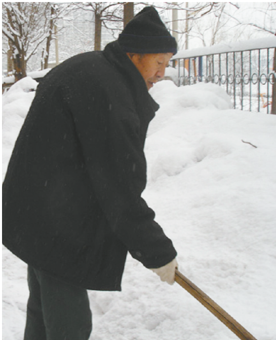
父亲带病在义务扫雪

当儿女们问我：姥爷这么大岁数哪来的精气神？我想：乐于助人，扶危济困，公而忘私，这就是父亲的追求吧！有追求的的人才有精气神！