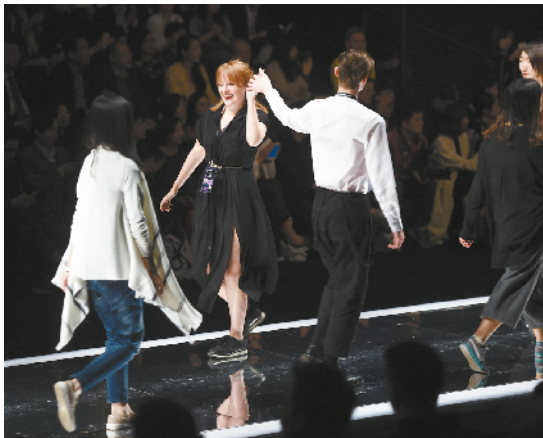
来自世界各地的服装设计师也走上T型台展示服装美丽。