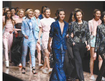
▲每天,中外模特要参加几场时装发布,她们总是把最好的形态展现给观众。