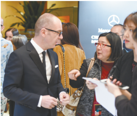
来自世界各地服装设计大师与中国设计师交流。