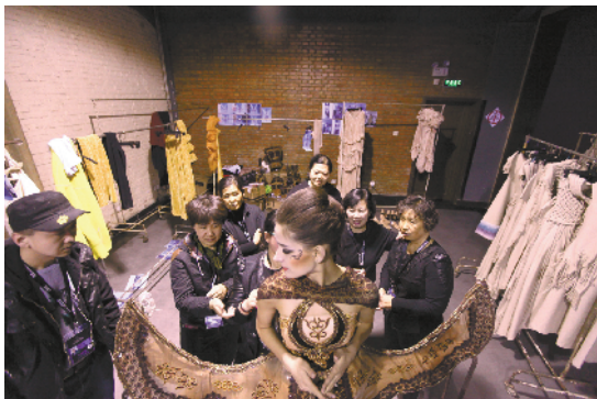
为了把最美的时装展现给观众，设计师在后台要做大量准备工作。