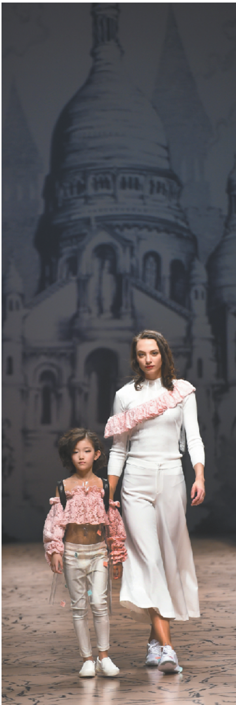
发布会上，设计师推出时装以母亲的审美视觉出发，展现女儿的“小大人”形象。

正在北京进行的中国国际时装周(2016/2017秋冬系列)发布会。以“设计+”为主题,在以设计为核心,广泛联系整个产业链和市场需求,推动产业结构调整 and 时尚文化的创新。