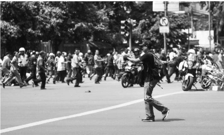
图为一名男子在向人群射击。