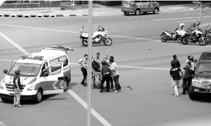
图为印度尼西亚首都雅加达，警察在爆炸袭击现场工作。

发生多起爆炸的说法，他说，袭击只发生在谭布林大街上的萨里娜购物中心及附近的交警岗亭。 印尼总统佐科当天发表声明，称这起袭击是恐怖行为，他同时呼吁各方在这起事件的调查结果公布前不要胡乱猜测。