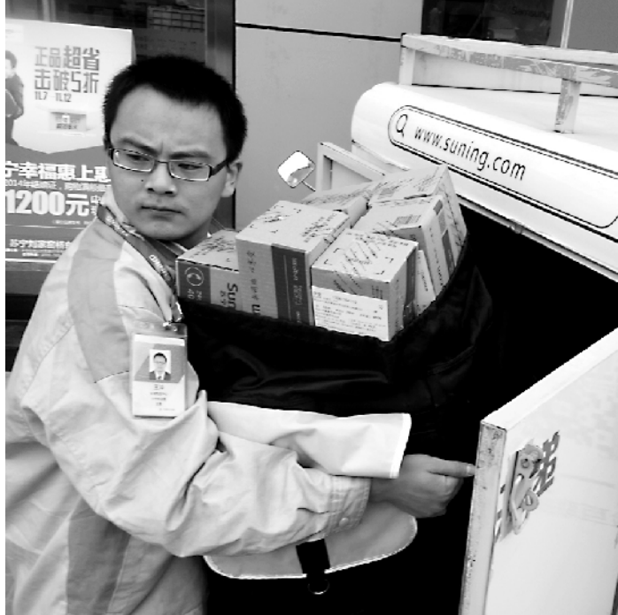
快递员载着满满的货品走街串巷收发邮件送达货物。