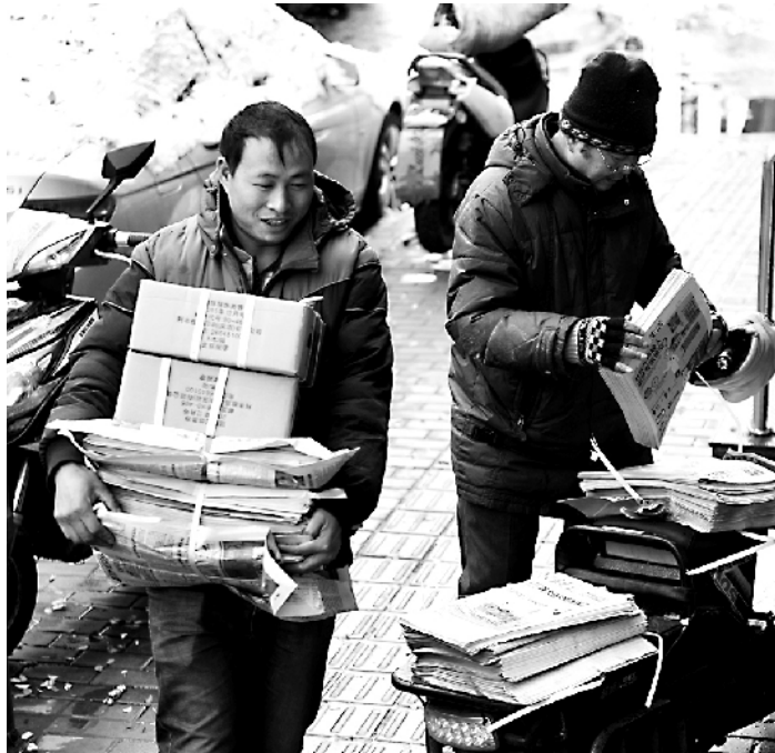
在小街邮局职工在寒风中分拣报刊发放到各个报刊亭。