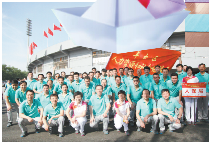
参加丰台区第十届全民健身体育节

同时,该局工会坚持开展为会员送温暖活动。每一位过生日的会员,都会收到工会送出的温馨祝福、精美贺卡和生日蛋糕。对因病住院或有人去世的会员,工会都能及时探望慰问,并将组织的温暖与关怀送到每位会员的心坎上。