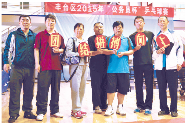
参加丰台区2015年“公务员杯”乒乓球赛