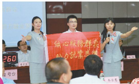
“提升服务意识,争做业务能手”参赛现场

一直以来,丰台区人力资源和社会保障局工会在丰台区总工会及局党委的领导下,始终秉承“以人为本”的思想,牢固树立一切为了职工、事事想着职工、处处依靠职工的服务理念,认真履行工会各项职能,充分发挥各工会小组和兴趣小组的优势和特点,注重激发全局干部职工提高自身素质的内在动力,为组织和动员工会会员以新的姿态和风貌投身于人力社保事业建设中,发挥了积极作用。