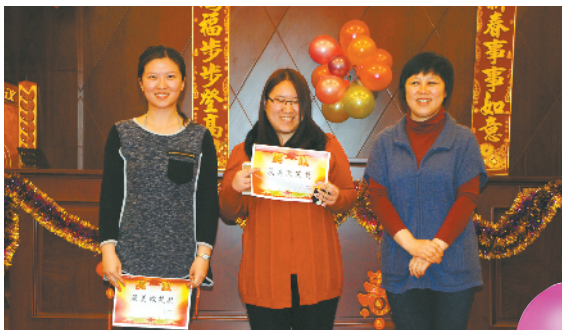
工会小组开展新春联欢会