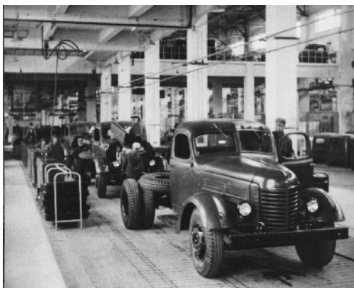
解放牌汽车生产车间（1957年摄）

时光荏苒，岁月如梭。转眼间，我和发小儿也都年过五十。2014年，我们先后当上了爷爷，尽享含饴弄孙的天伦之乐。我们在一起度过的岁月，都成了温暖、感动的美好回忆。我们共处一个小城，时刻保持着最亲密的联系。我和发小儿的这份情谊如同一首深情的老歌，令人心神荡漾，回味无穷！