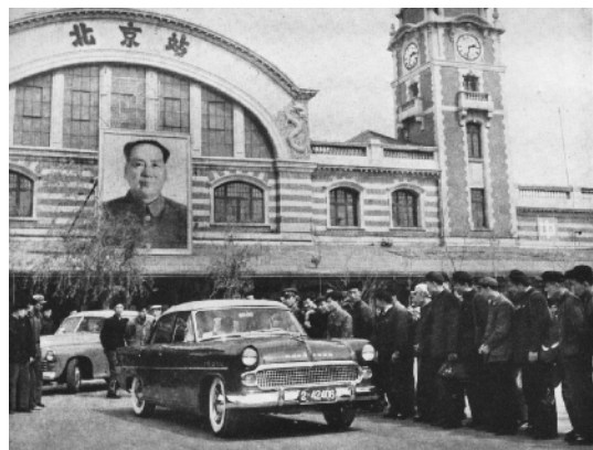
东风牌轿车开到北京（1958年摄）