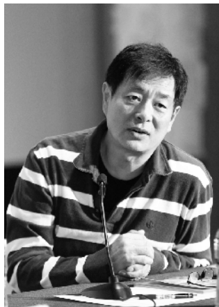
濮存昕：中国戏剧家协会主席、北京人民艺术剧院副院长

点评：《员工关爱行动指南》不是一个文件，而是一个表格，他们把四个大方面的16项具体内容，都进行了内涵的诠释，还规定执行时间和执行部门，让整个指南看起来极具操作性。