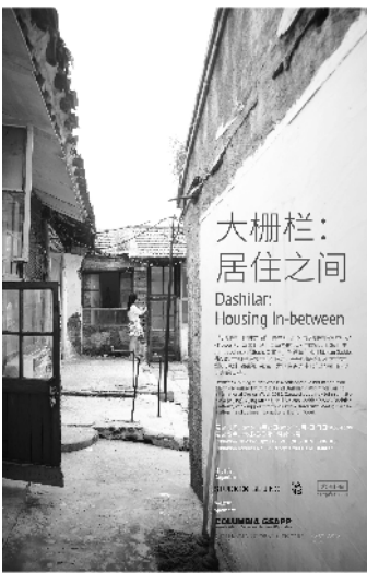
大栅栏：居住之间 Dashilar: Housing In-between