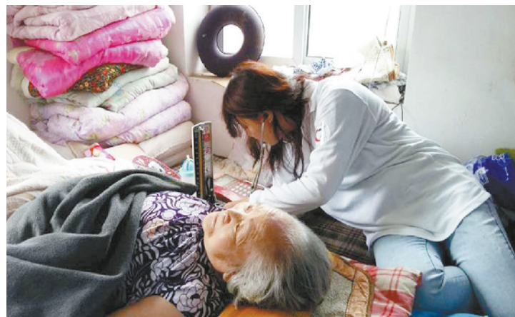
椿树社区服务中心进房山为老党员义诊