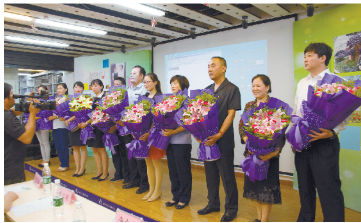
西长安街百姓宣讲团宣讲活动现场

据了解，近年来椿树社区卫生服务中心一直关注老年人健康问题，尽可能不断改变自身服务模式，为老年人提供更优质的医疗服务。