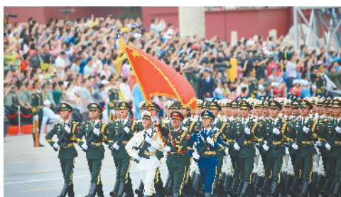
图为参加演练的三军仪仗队。