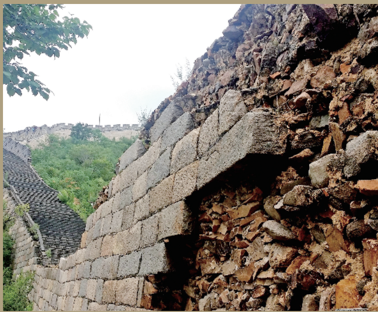
痕迹·沧桑