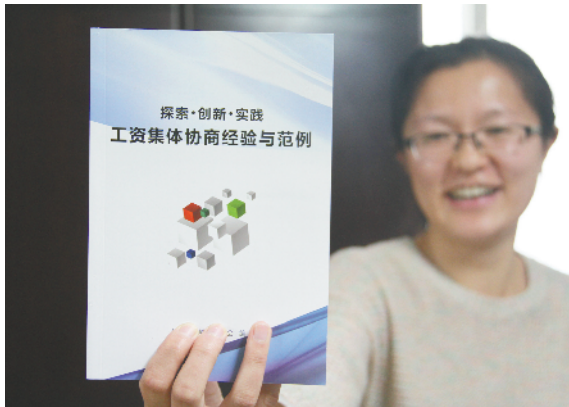
发到职工手中的《探索·创新·实践——工资集体协商经验与范例》