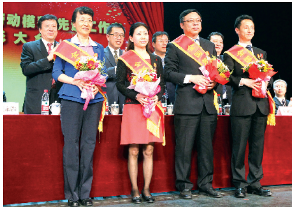
劳动模范与先进工作者受表彰现场