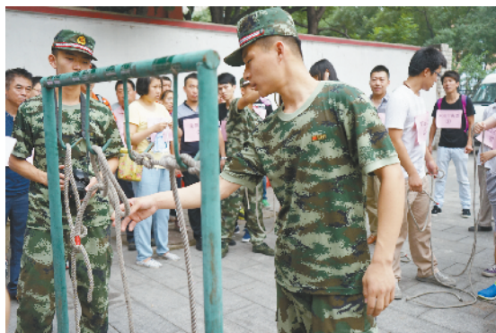
消防官兵讲解如何打绳结