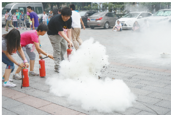
齐心协力将火扑灭