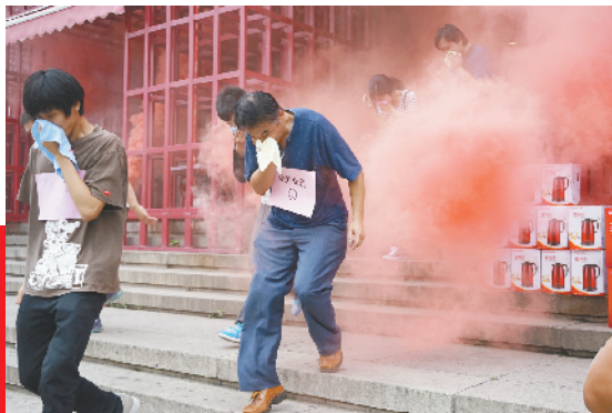
浓烟下，职工们紧急疏散