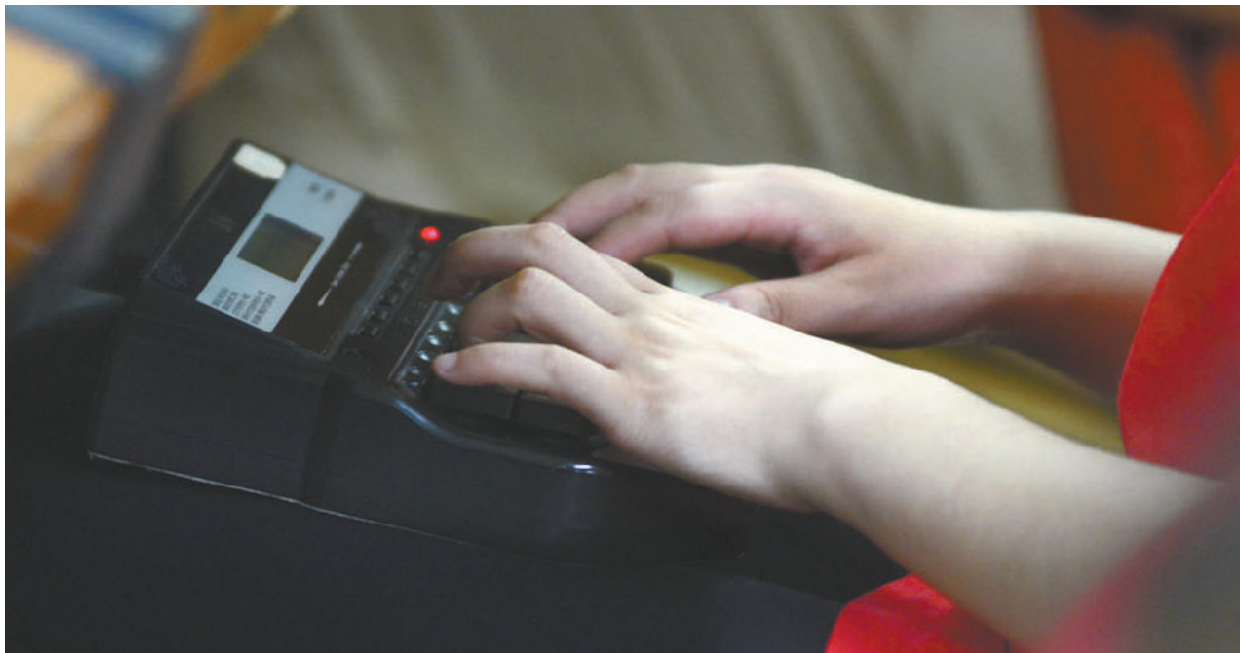
参赛选手指尖上下飞舞。