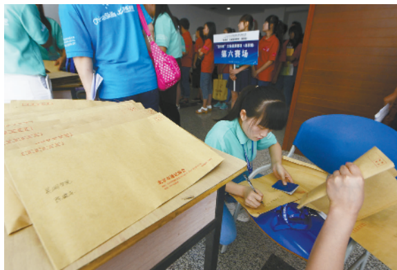
比赛检录处的工作人员快速整理参赛选手的个人资料。

在当今新媒体的快速发展、信息爆炸的时代，速录行业也迎来了高速的发展，据介绍，目前“北上广”等城市对高级速录师的需求一直有增无减，速录师的起薪从3000元至过万元不等，仅在北京，速录员行业人才就有1万左右缺口，多所职业院校开设的文秘专业中加强了学生在速录方面的技能训练，以适应以后就业的需求。