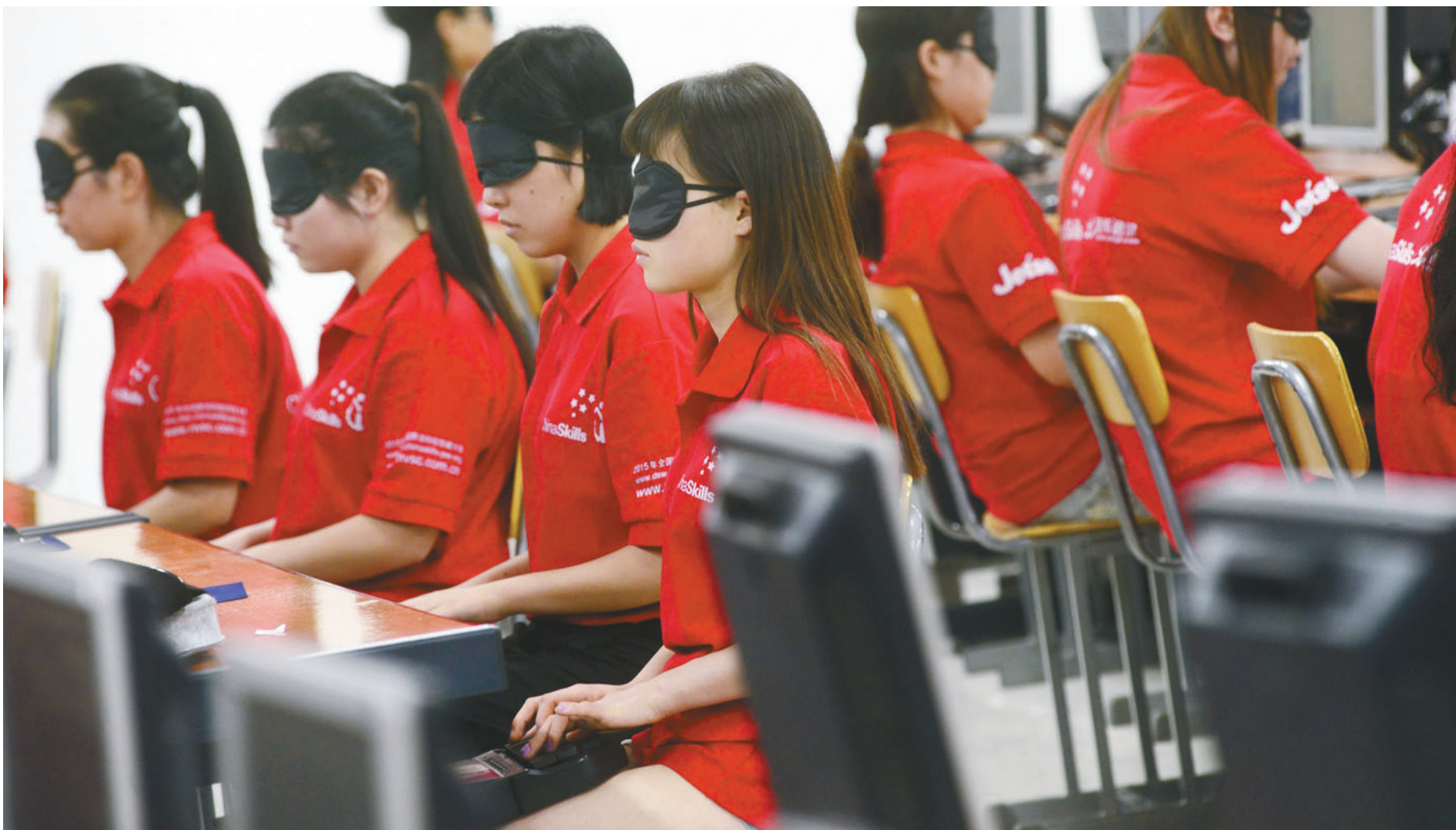
蒙目速录比赛，选手们戴着眼罩仍然能熟练打字。