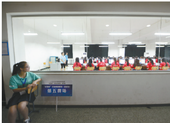
观摩教室宽敞明亮，比赛环境比往年大有提高。