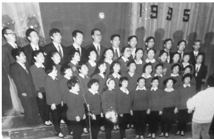
1995年，技术科党支部参加庆“七一”歌咏比赛时，高唱《没有共产党就没有新中国》。