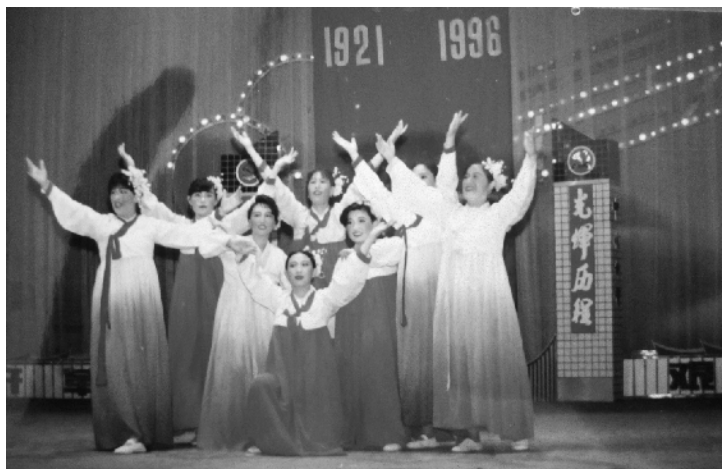
技术科党支部女工在厂党委举办的“纪念建党75周年文艺晚会”上的演出剧照。图中后排正中是本文作者。