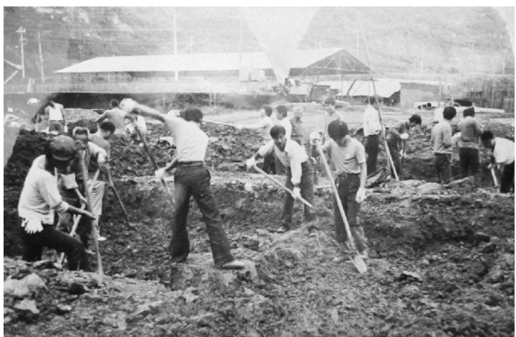
1980年7月1日，我们全体党员参加新厂房基础大汇战的场面。

一晃几十年就过去了，当我在夕阳下回首看人生的时候，那面鲜红的党旗，不但映红了我一生的笑脸，而且更重要的是给了我一生中的鞭策，让我为实现自己在鲜红的党旗下的誓言，不停地奋斗着。