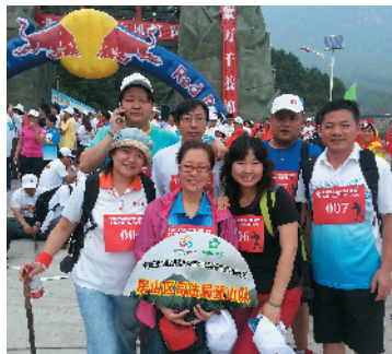
Z-62 凝心聚力 北京市房山区司法局