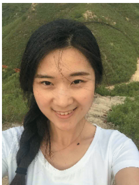
R-69 梦想 北京市顺义区市政市容管理委员会