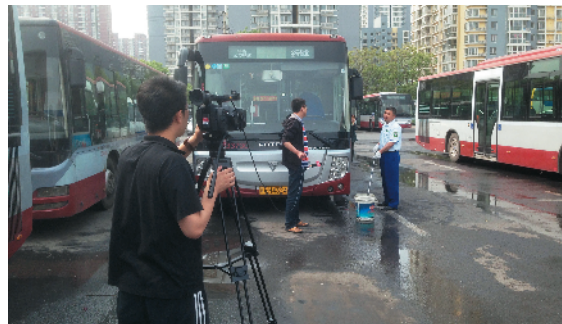
Z-63 传递正能量 北京公交第三客运分公司