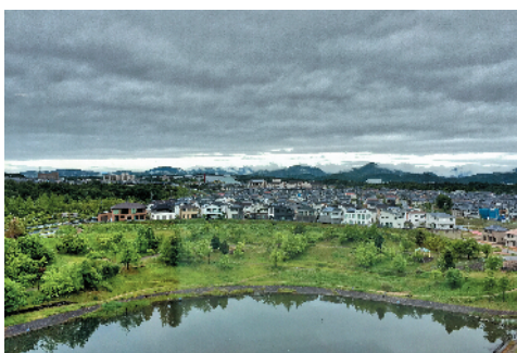
F-60 静静的村庄 北京市第三建筑工程有限公司 任萌/摄