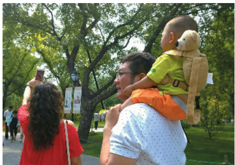
J-63 爱心传递 西城环卫中心