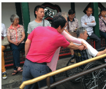
S-63 搭把手 和平里军休所 解秀华/摄