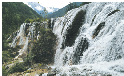
F-61 九寨风光 北京翠微大厦股份有限公司 梁莎莎/摄