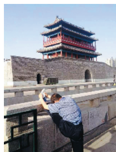
S-64 支撑 中国现代文学馆