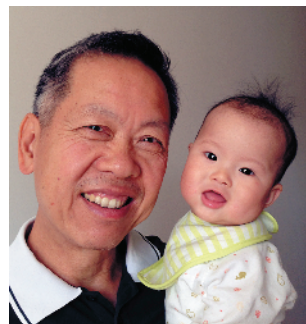
J-64 天伦之乐 自来水集团管网管理分公司 吴水莲/摄