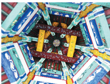
F-59 柱之亭心

无论是旅游还是外出办事，见到让您感动的美景就可以照下来并向这里推送。让大家分享您的情趣。