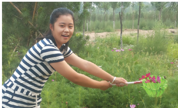
R-70 花儿与少年 门头沟区总工会