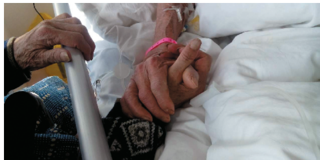
J-65 牵手祝福 北京市怀柔一中 周璐/摄