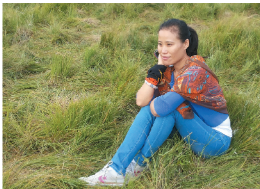
R-68 静、思 门头沟区总工会 李爱菊/摄

肖像摄影可需要一点艺术味啊，无论是光影、构图、色彩、人物表情，都要有所表现。这里，画面以人为主。