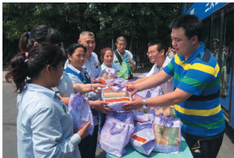
Z-61 体惜职工 北京公交第三客运分公司第三车队