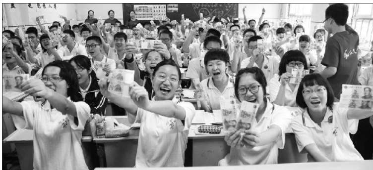
“发钱”迎高考折射教育“失常”

6月3日，河北衡水二中为每位备战高考的高三学生发放了两张5元崭新连号人民币留作纪念。十元钱代表“十全十美”，连号则代表“顺顺利利”，这是该校多年来考前减压活动之一，也是送给考生们的真诚祝愿。收到学校的“福利”和祝福，考生们开心不已。(6月4日新华网)