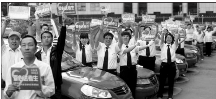
“爱心送考”别变成作秀

毋庸讳言，一年一度的高考，令多少学校、家长为之操心劳神。高考的指挥棒像无情的鞭子在抽打着学校、家长，在“升学率指标”重压状态下的老师们“临阵大乱”，也要通过各种方法为自己减压，于是病急乱投医。曾经有一拨儿又一拨儿的高三老师领着学生烧香拜佛，祈祷着自己带的学生高考能有个好“收成”。派老师到庙里求神，已经成为不少学校的公开秘密。