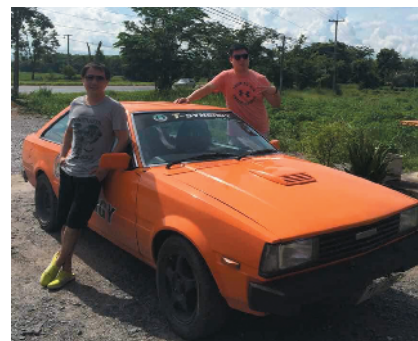
J-52 哥们来度假