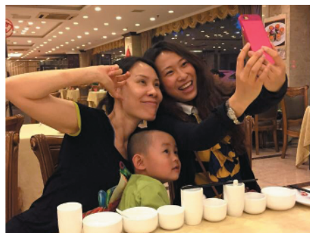
J-51 笑一个 航天人才开发交流中心