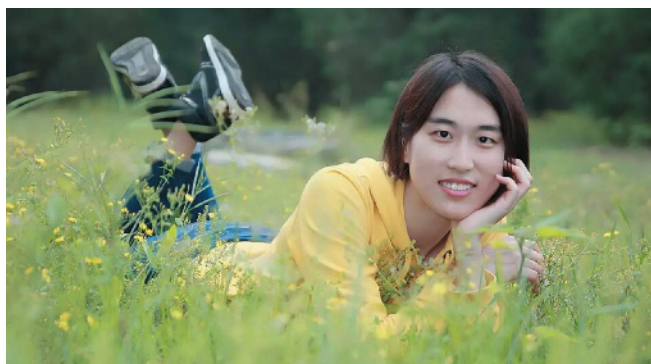
R-56 唯美心情 中元国际投资公司 郇象海/摄

肖像摄影可需要一点艺术味啊，无论是光影、构图、色彩、人物表情，都要有所表现。这里，画面以人为主。