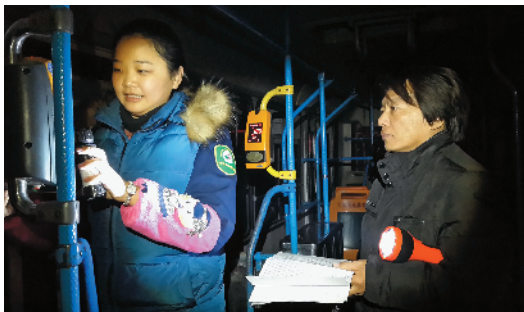
Z-50 公交人的忙碌 公交集团第五客运分公司第三车队(350路)