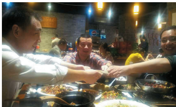
J-50 十五年兄弟情 北京中恒四方有限公司