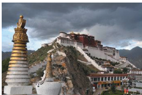
F-48 布达拉宫 北京市丰台区丰台第一幼儿园

无论是旅游还是外出办事，见到让您感动的美景就可以照下来并向这里推送。让大家分享您的情趣。