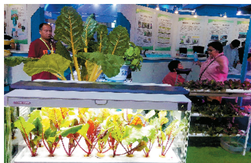
S-52 阳台小菜园展示 北京红都集团公司