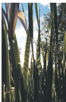
F-49 露珠 朝阳区来广管社区卫生服务中心 佟健/摄