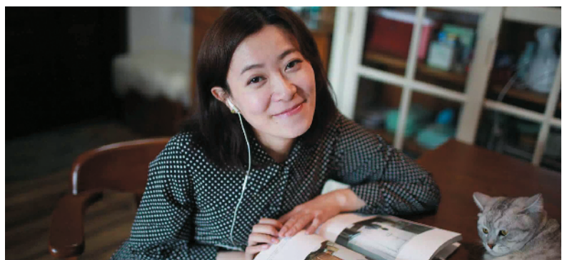
R-57 我的简单生活 首旅置业