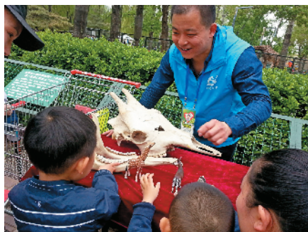
S-50 小朋友学习动物知识 北京市宏运实业集团公司 霍玉平/摄