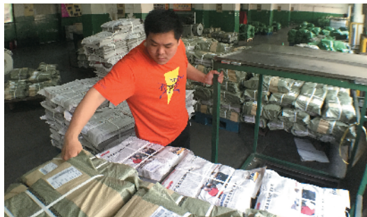
Z-49 我的报纸阵地 北京报刊发行局