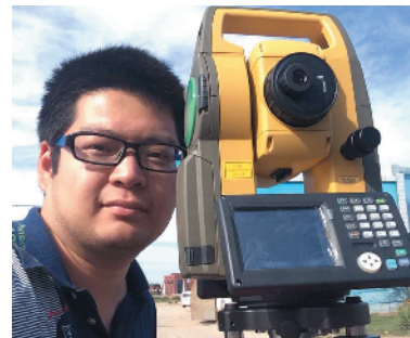
Z-51 测绘工作 北京住总集团