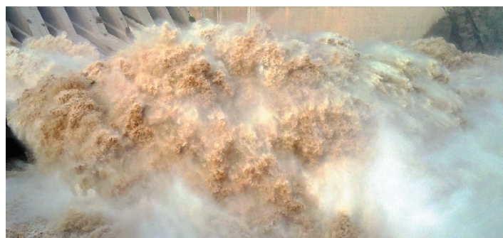
F-50 奔腾而出 北京港通路桥工程监理有限责任公司 郭广世/摄