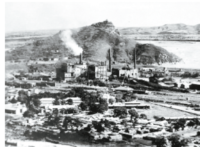
上世纪40年代的石景山发电厂。