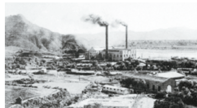
上世纪30年代的石景山发电厂