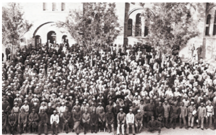
工人学校开学典礼时，毛泽东等中央领导人与学员合影。