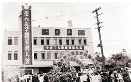
1948年8月1日，第六次全国劳动大会在哈尔滨举行。