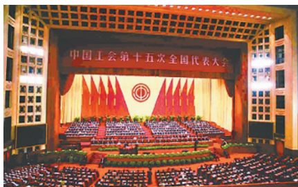
2008年10月17日至21日，中国工会十五大在北京召开。

【事件】中国工会第十五次全国代表大会 【时间】2008年10月17日至21日 【地点】北京