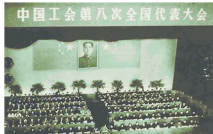
1957年12月2日，中国工会第八次全国代表大会在北京举行。

【事件】中国工会第八次全国代表大会 【时间】1957年12月2日至12日 【地点】北京