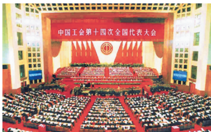
2003年9月22日至26日，中国工会十四大在北京召开。

【事件】中国工会第十四次全国代表大会 【时间】2003年9月22日至26日 【地点】北京