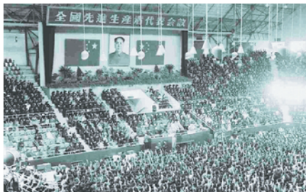
1956年4月30日，全国先进生产者代表会议在北京召开。

【事件】中国工会第七次全国代表大会 【时间】1953年5月2日至12日 【地点】北京