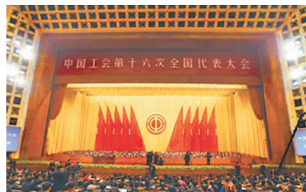
2013年10月18日至22日，中国工会十六大在北京召开。

【事件】中国工会第十六次全国代表大会 【时间】2013年10月18日至22日 【地点】北京