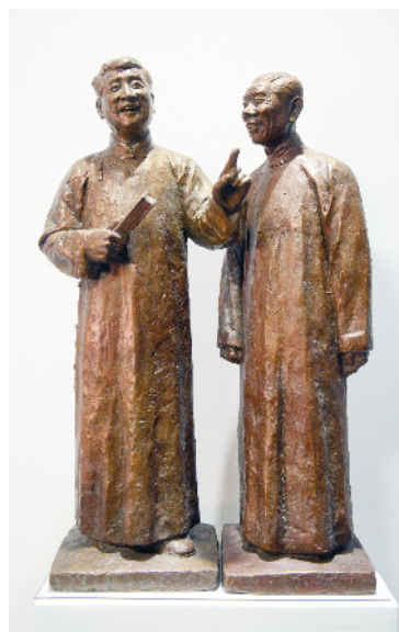
纪峰的人物雕塑作品栩栩如生。