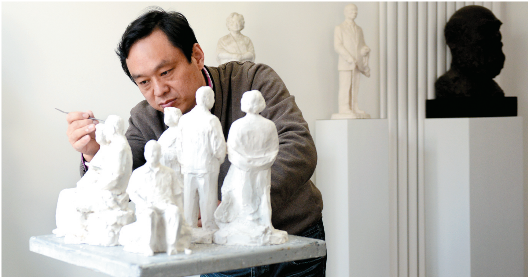
纪峰在工作室里正在起草新的雕塑作品。

职工故事 行进京华大地 讲述精彩故事 线索征集邮箱: ldwbyw@126.com