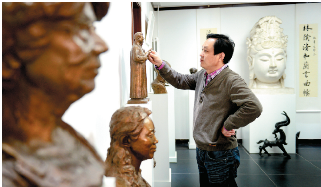
他常常与自己作品中的“人物”对话寻找灵感。