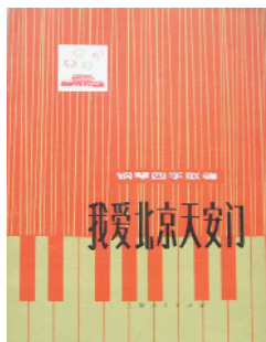
《我爱北京天安门》歌曲集