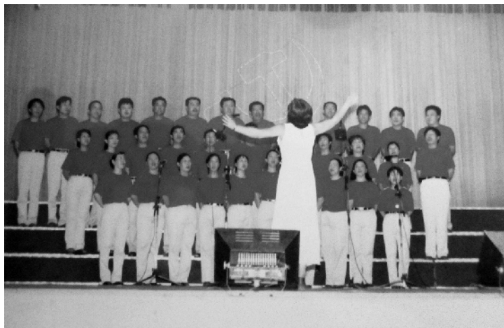
上世纪80年代，我们这一代在唱《英雄赞歌》。