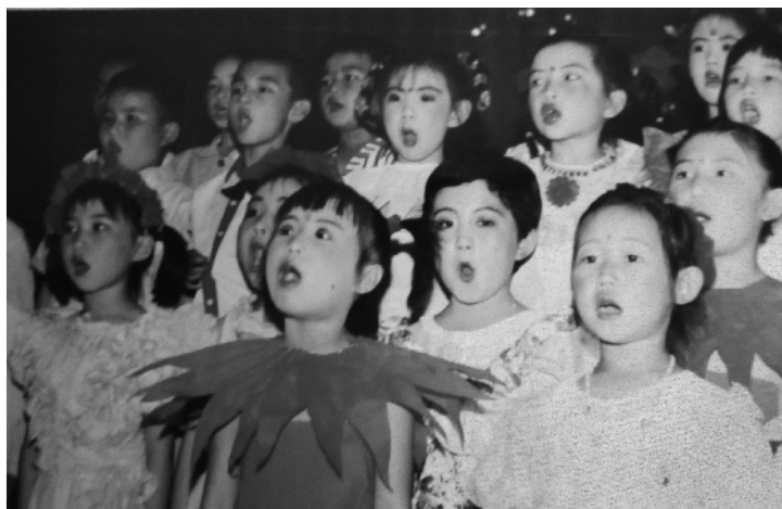
上世纪90年代，我女儿和她的同学们在唱《英雄赞歌》。