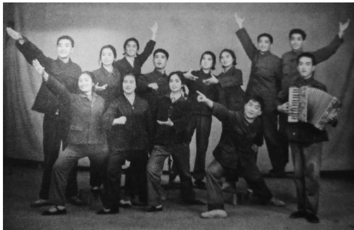
上世纪70年代，下乡知青在唱《英雄赞歌》。

本版热线电话:63523314 本版邮箱:ldwbgh@126.com 本版面向所有职工征集稿件