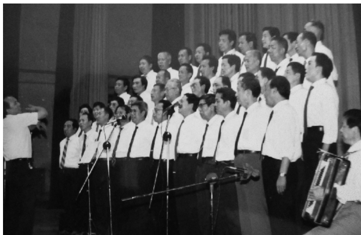
粉碎四人帮后，我的父辈们在唱《英雄赞歌》。