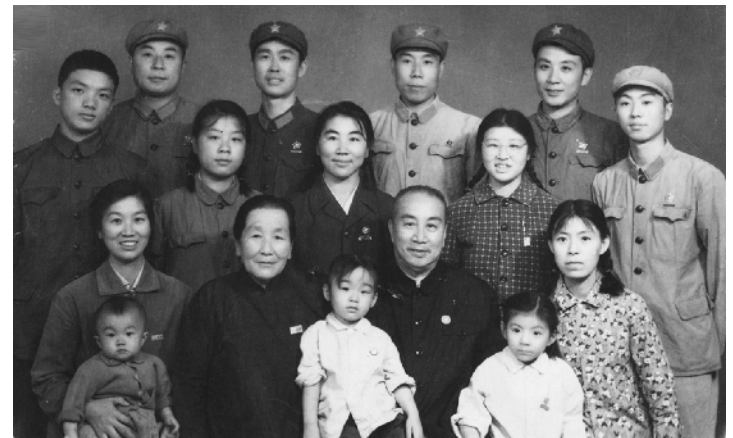
1968年国庆节，我们一家人在北京的合影。