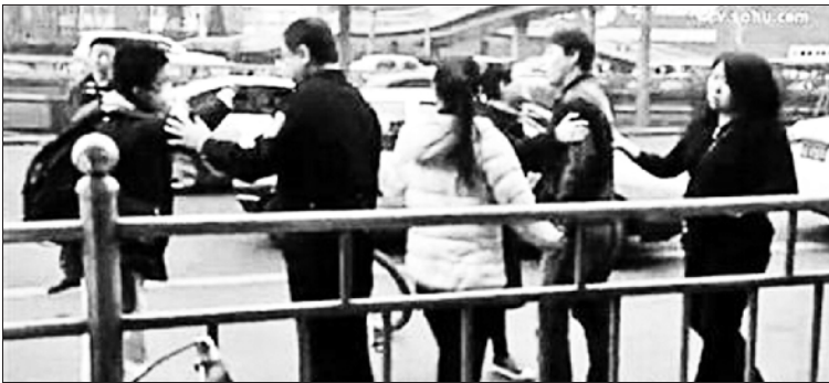
中学生拍占道车是“书读傻了”?

昨天，一则名为“汽车占自行车道，初中生拍照被骂”的视频备受网友关注。视频显示，在海淀双安商场附近的一处天桥下面，一名初中生用手机拍摄了一辆占用非机动车道的私家车，遭到私家车上3女1男集体下车“围攻”。虽然整个事件孰是孰非目前尚无法彻底理清，但私家车占用非机动车道以及“读书读傻了”的话题再次引发网友的讨论。（3月29日《北京青年报》）