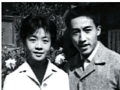
庄则栋与鲍惠莽夫妻