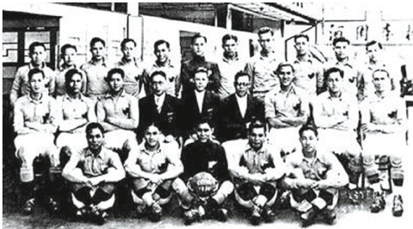
参加1936年奥运会中国足球队合影