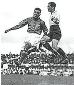
1935年中国队对阵印度队