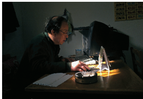
Z-30 午休时间学电脑 万方西单商场