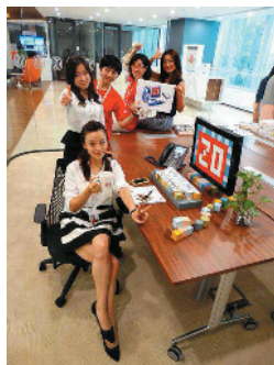
Z-29 美女军团 仲量联行