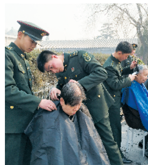
S-32 送服务 北京报刊发行局