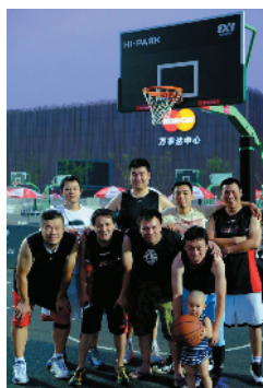
J-29 我们的篮球梦 联通公司