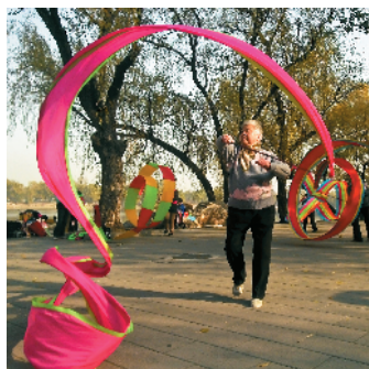
S-29 飞彩 石景山区金顶街街道总工会