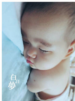
R-33 白日梦 首都师范大学 李秦/摄