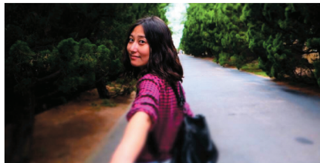
R-34 牵手去旅行 海洋国旅