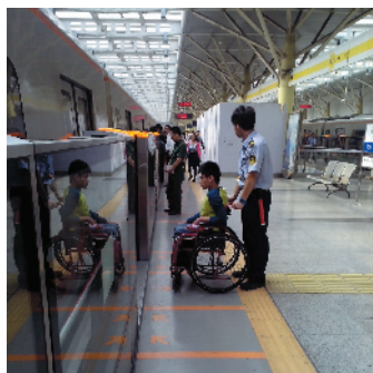
S-30 助残服务 北京市宏运实业集团公司