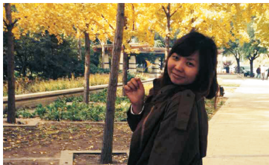
R-32 回眸一笑 华夏金融 王磊/摄

肖像摄影可需要一点艺术味啊，无论是光影、构图、色彩、人物表情，都要有所表现。这里，画面以人为主。