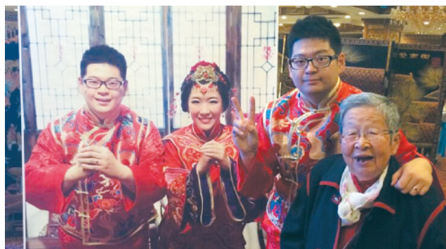
J-30 长辈的祝福 同仁堂集团