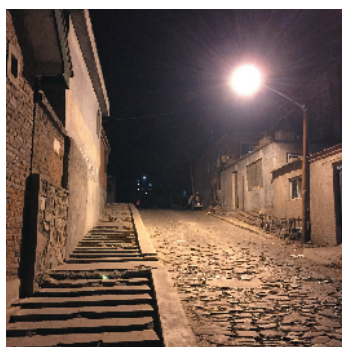
F-29 回家的路 北京鑫华源机械制造有限公司 孙洋/摄

无论是旅游还是外出办事，见到让您感动的美景就可以照下来并向这里推送。让大家分享您的情趣。