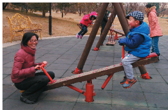
J-31 童真跷跷板 卢沟桥村委会