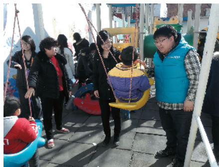
S-31 关爱自闭症儿童 公交车客运分公司 王国良/摄