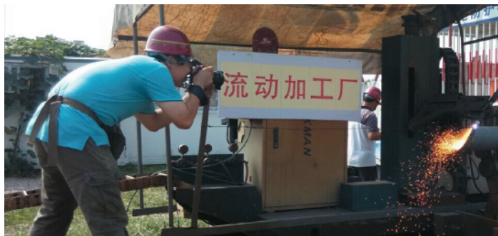
Z-31 敬业 北京建工机械公司