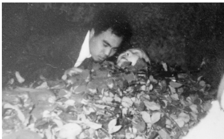
送别冰心，我与老人最后一次“合影”，依依惜别。

1999年2月28日，冰心老人遗憾地告别了人世。八宝山送别仪式上，领导来了，亲友来了，读者来了，海外的好友来了，送行的人不计其数，送别的队伍排