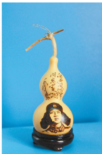
雷锋精神永烙心中