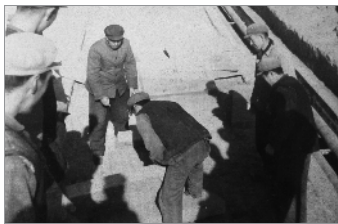
这幅图片拍摄于1975年农历的腊月二十九。职工们正在为实现“再鼓一劲，全面完成厂区硬化地面工程，向新春献礼”的口号，继续战斗在施工一线。