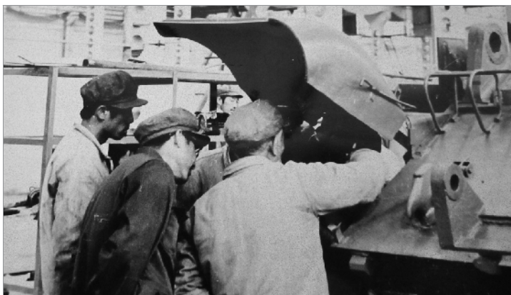
这幅图片拍摄于1982年农历的正月初二。当时，在全厂职工干部和工程技术人员共同努力下，由国营红山机械厂研发的首台军车进入总装和原地发动工序。这是技术人员在做原地发动前的最后一次调试工作。