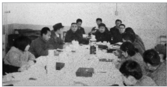
这幅图片拍摄于1979年农历的大年初一。当时全厂职工欢欣鼓舞地接受了首台军车的研制任务。图为全体技术人员正在讨论研制大纲。