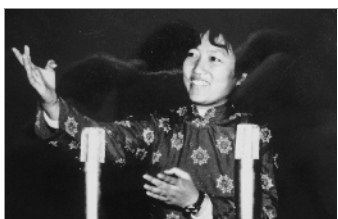
这幅图片拍摄于1984年春节。当时由国营红山机械厂自主研制的首台军车一举通过军方鉴定，并投入批量生产。这是在春节文艺晚会上，职工民歌手放声歌唱，热烈庆祝“振军威、壮国威”的军车投入生产。