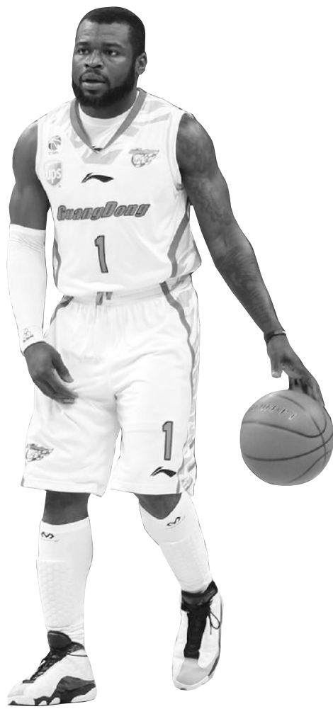
拥有拜纳姆让广东队如虎添翼

在假期中，北京队也依然没闲着，老马不仅取消了原定在春节期间的度假行程，更是与几名